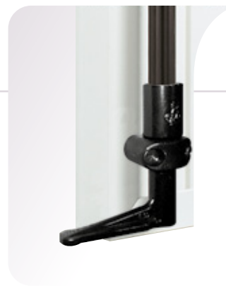
EMBOUIT D'ESPAGNOLETTE ALUMINIUM