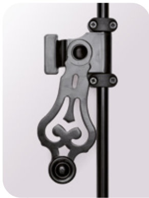
ESPAGNOLETTE CLASSIQUE ACIER EN STANDARD