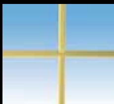
Laiton 10 mm