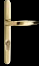
Finition laiton poli ENS 22