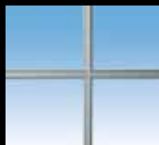
Plomb 10 mm