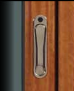
Poignée escamotable pour coulissant