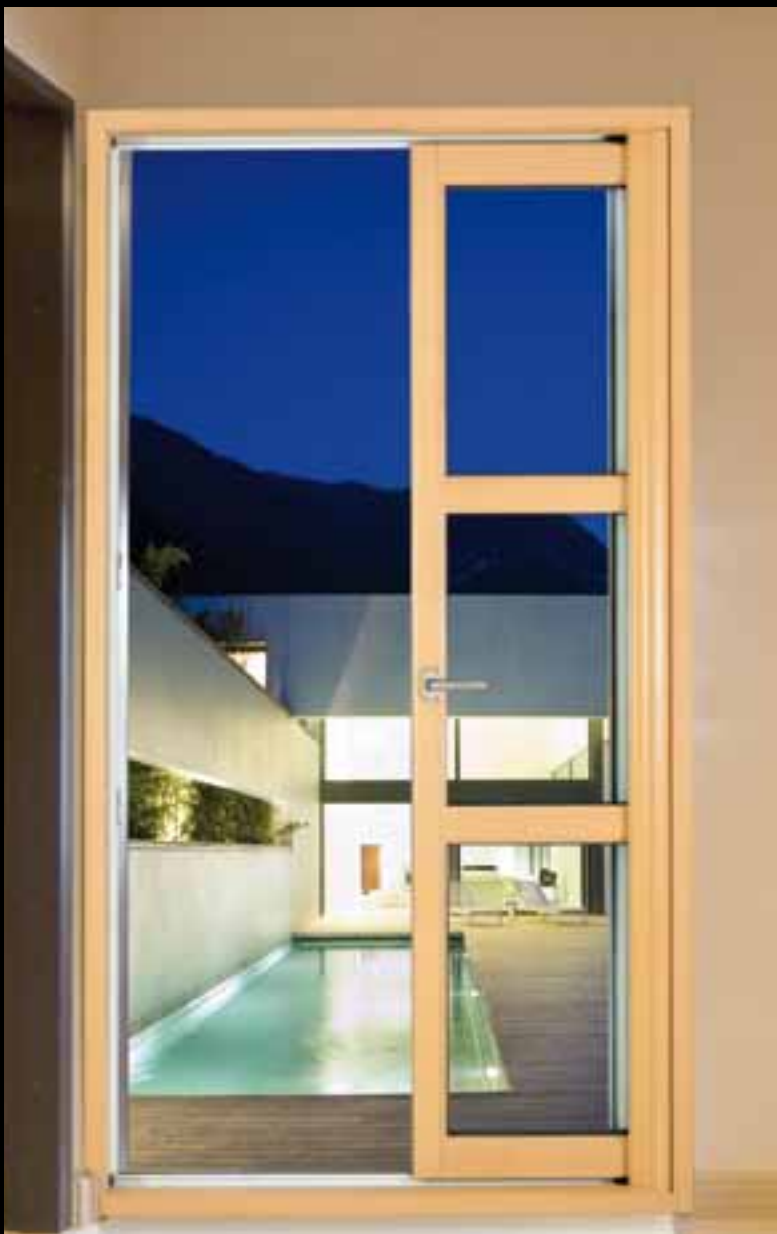
Bois côté intérieur

Par l'effacement total des vantaux dans la cloison, les coulissants à galandage augmentent votre espace de vie. Cette possibilité vous est offerte en un vantail avec refoulement à gauche ou à droite et en deux vantaux sur 1 rail avec refoulement de chaque côté de la baie.