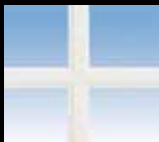
Blanc 26 mm