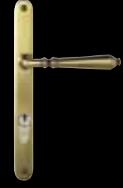
Finition laiton vieilli EA 92