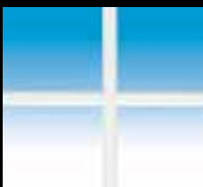
Blanc 10 mm