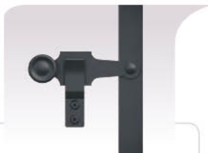
ESPAGNOLETTE plate alu EN STANDARD SUR LES MODÈLES MEDLEY