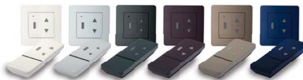
Emetteurs muraux et télécommandes COLOR+