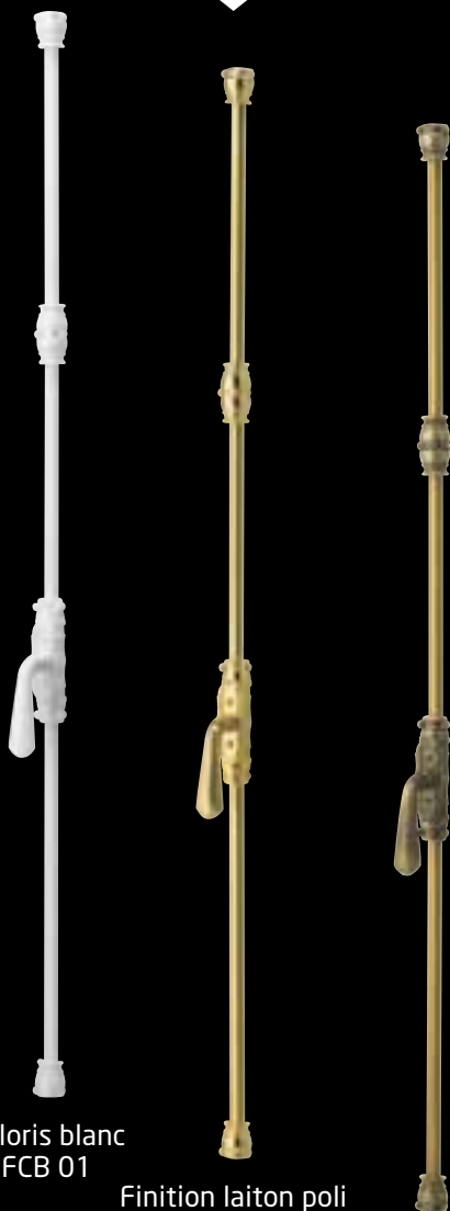
Coloris blanc FCB 01