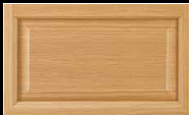
Le panneau soubassement «plate-bande»

2 types de soubassements existent pour les portes fenêtres mixtes