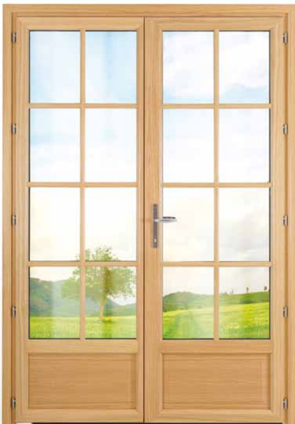
Porte-fenêtre 2 vantaux avec petits bois menuisés.

Fabriquées sur mesure, nos portes fenêtres vous donneront une entière satisfaction à l'intérieur et à l'extérieur avec une finition soignée.