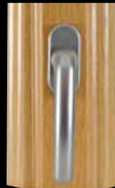
Battement avec poignée centrée en option