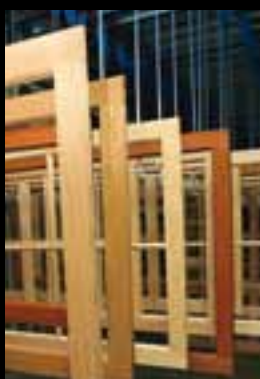
Panneau à plate bande