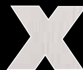
PRÉPEINT non vernis