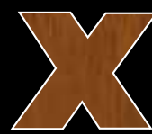
CHÂTAIGNIER teinté merisier blond (en option)