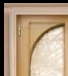
Coin de mouchoir