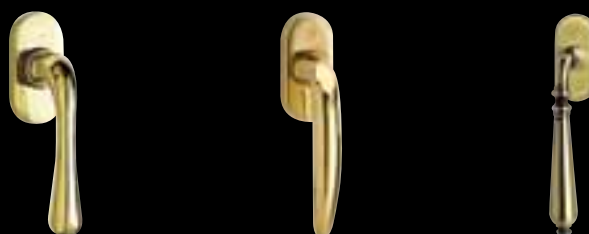
Finition laiton poli BS 12