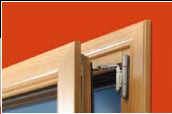
Détail du mécanisme oscillo-battant

La gamme SEDUXIA, c'est toute l'esthétique d'une fenêtre moderne avec ses lignes arrondies et chaleureuses et sa finition ébénisterie. Le clair de jour est optimisé avec son battement réduit pour laisser rentrer la lumière au maximum. Séduxia joue aussi la sécurité avec sa poignée Sécustik et son verrou bas à levier. (cf p62)