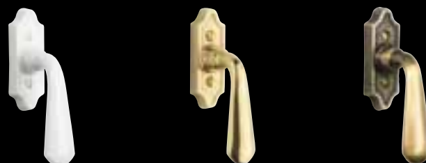
Coloris blanc PDB 01