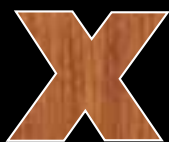
BOSSÉ teinté moabi (en option)