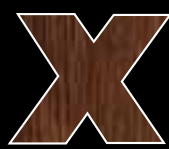
CHÂTAIGNIER teinté merisier antique (en option)