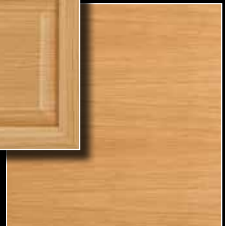
Le panneau soubassement lisse