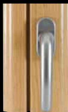
Poignée Sécustik® en standard