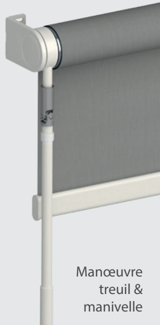
Manœuvre treuil & manivelle