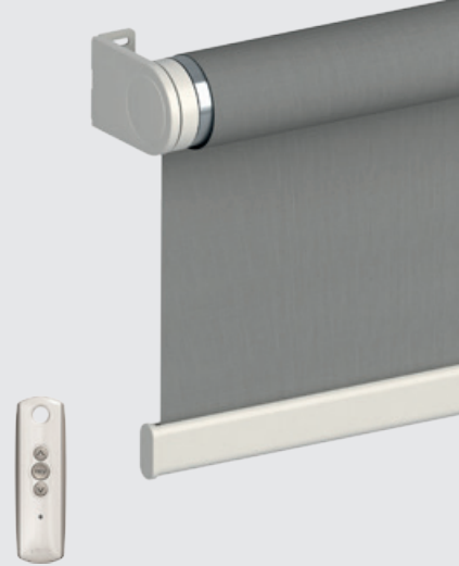
Manœuvre motorisée 230 V Somfy filaire, radio ou autonome avec batteries