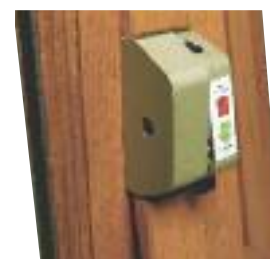
Pivot avec arrêt à 25° et blocage à 180° par bouton poussoir