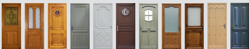
Laurie Muriel Amélie Daphnée Opéra Castellane Maurane Nina Océane Selena Casilda