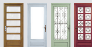
Thelma Salomé Sidorie Solène