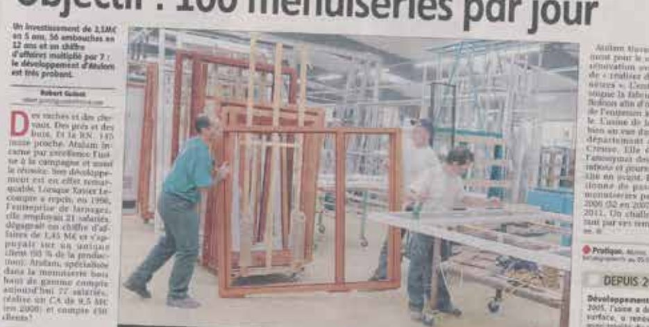
QUALITÉ. L'usine de Jarnages, toujours renommée pour son savoir-faire, accorde la priorité à la qualité.