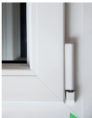
Soudure fine Assemblage en coupe d'onglet