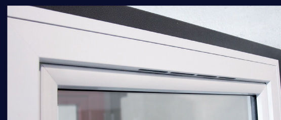
Grille de ventilation