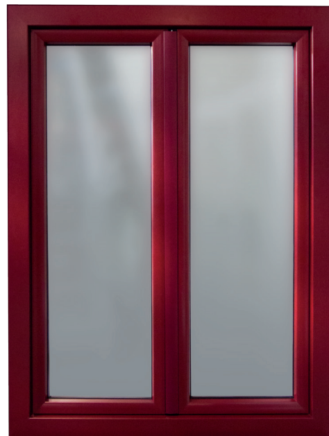
Présentation de l'hybride 70 rouge pourpre

Le drainage des eaux s'effectue par la traverse basse. Les pare-tempêtes sont supprimés.