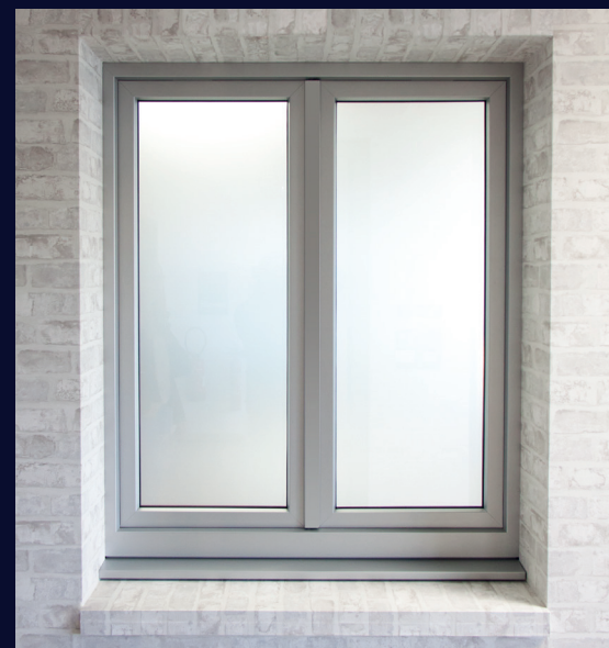
Présentation de l'hybride 70 extérieure